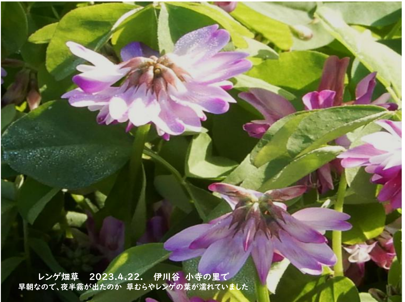
レンゲ畑草 2023.4.22. 伊川谷 小寺の里で 早朝なので、夜半霧が出たのか 草むらやレンゲの葉が濡れていました