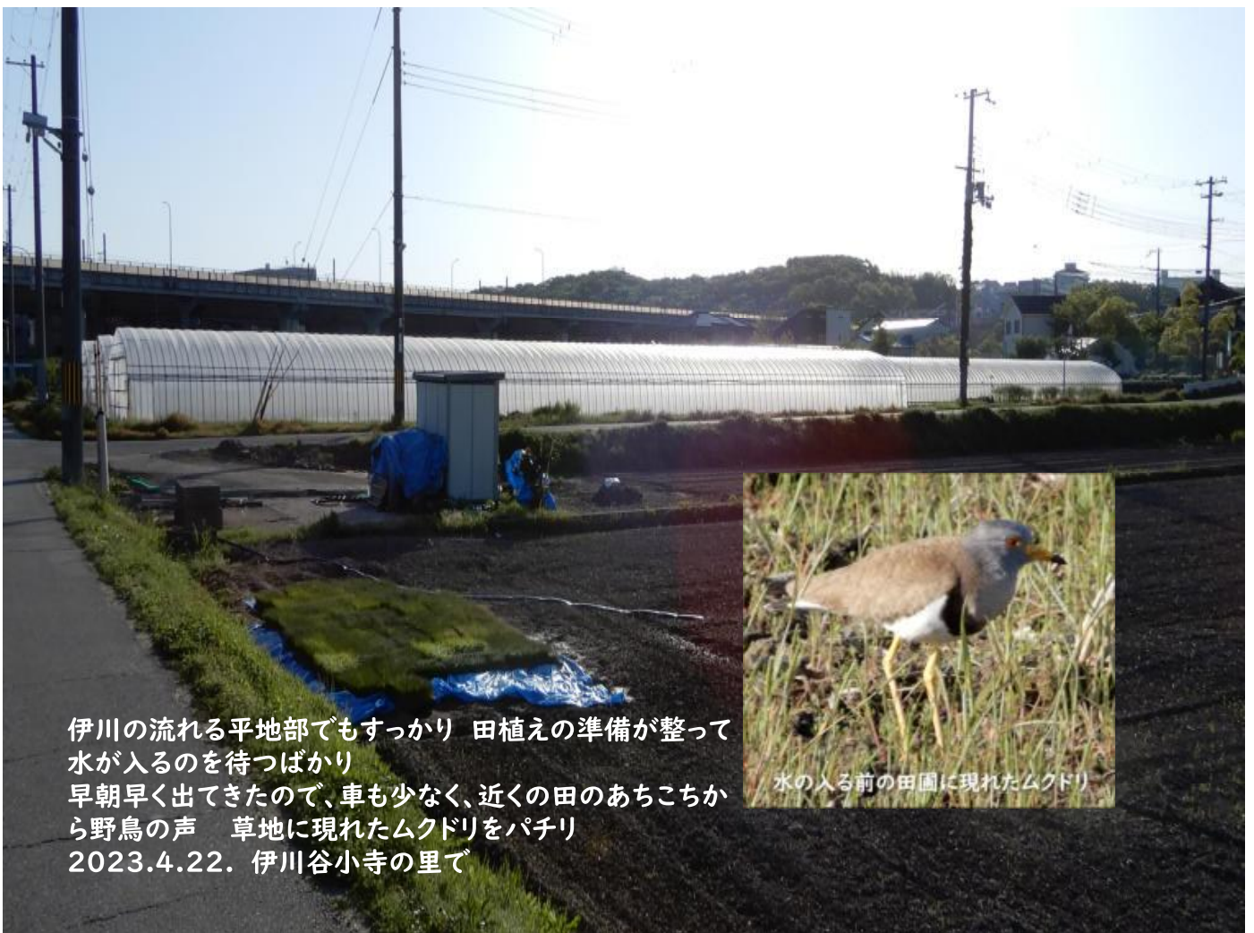
伊川の流れる平地部でもすっかり 田植えの準備が整って 水が入るのを待つばかり 早朝早く出てきたので、車も少なく、近くの田のあちこちか ら野鳥の声 草地に現れたムクドリをパチリ 2023.4.22. 伊川谷小寺の里で