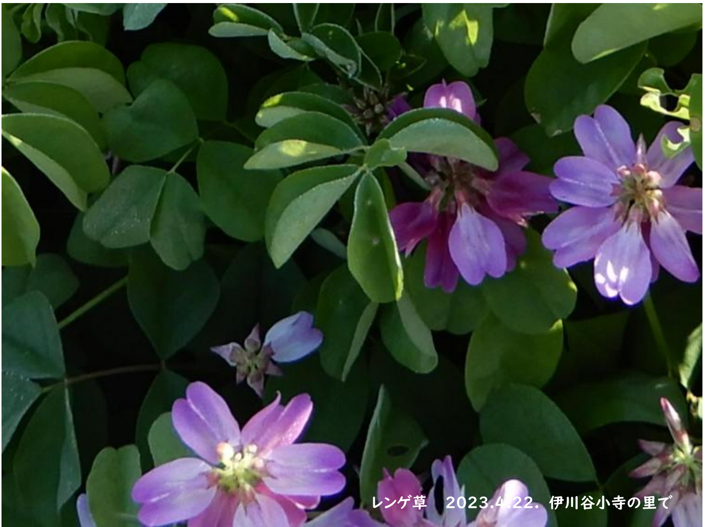
レンゲ草 2023.4.22. 伊川谷小寺の里で