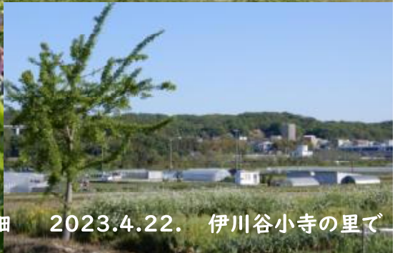
伊川谷 小寺の里のレンゲ畑 2023.4.22. 伊川谷小寺の里で