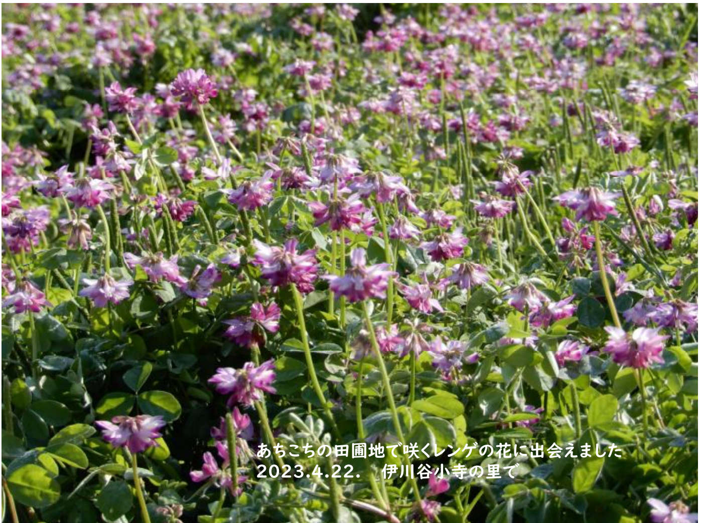
あちこちの田圃地で咲くレンゲの花に出会えました 2023.4.22. 伊川谷小寺の里で