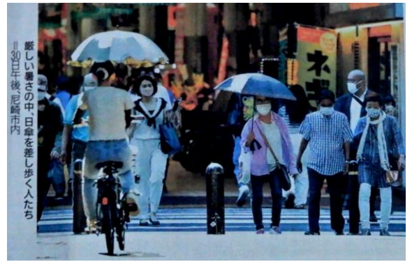
2022. 7. 1. 神戸新聞朝刊より

【追伸】 7月更新のHP pageにかききれませんでした、 早い異例の梅雨が明けた途端 猛暑になりました また コロナもじわじわ増加の兆し ウクライナの情勢も混沌と 巷ではやたらに参議院選挙のポスターが目につきますが、 今の世相に新しい風を吹きこんでくれるのでしょうか……