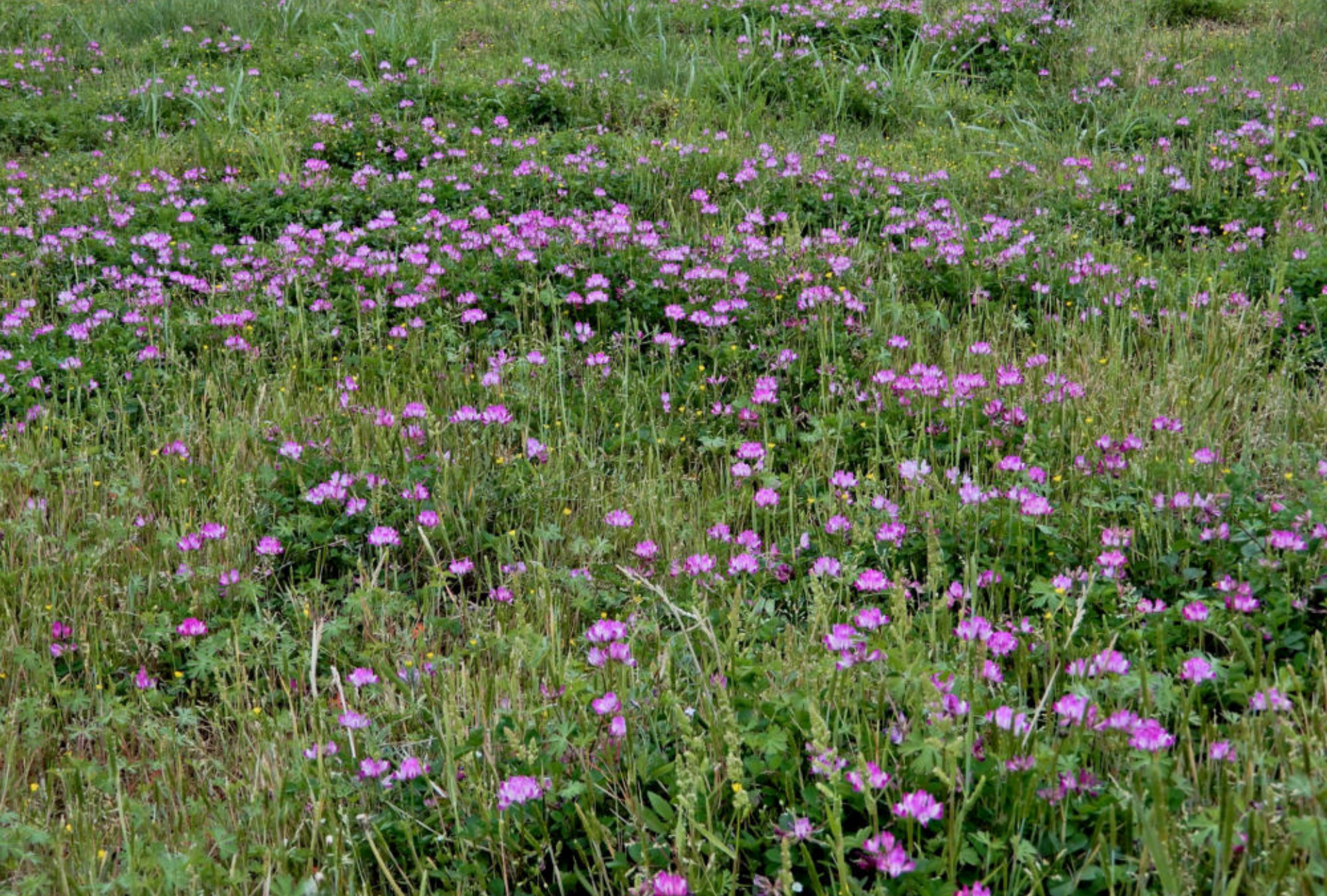
伊川谷小寺 春の田園地帯で 野草と混じって咲くレンゲの花 2022.4.9.