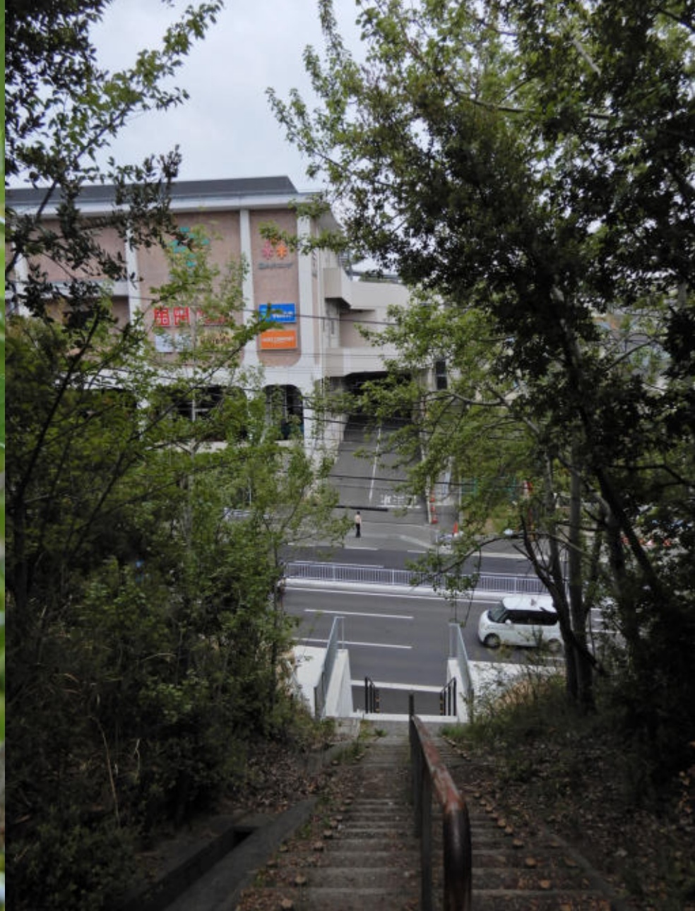
西高塚山の山腹を東にめぐるハイキング道 学園都市出口 2022.4.9. 学園都市小束山手の商業施設ブランチの前に 左学園都市 右垂水をつなぐバス道路 ハイキングロードはこの道の向こう左手 小束山手住宅地入口北の峠横に高塚山入口がある