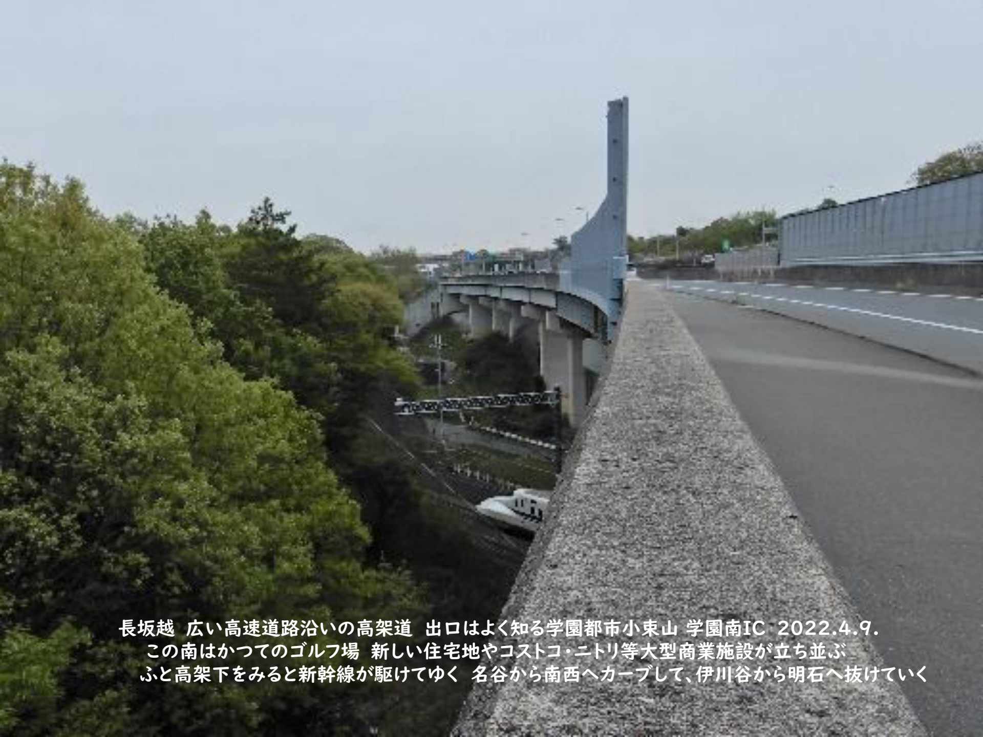
長坂越 広い高速道路沿いの高架道 出口はよく知る学園都市小東山 学園南IC 2022.4.9. この南はかつてのゴルフ場 新しい住宅地やコストコ・ニトリ等大型商業施設が立ち並ぶ ふと高架下をみると新幹線が駆けてゆく 名谷から南西へカーブして、伊川谷から明石へ抜けていく