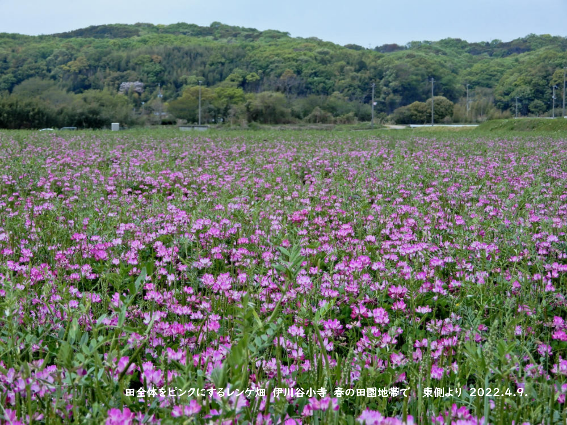
田全体をピンクにするレンゲ畑 伊川谷小寺 春の田園地帯で 東側より 2022.4.9.