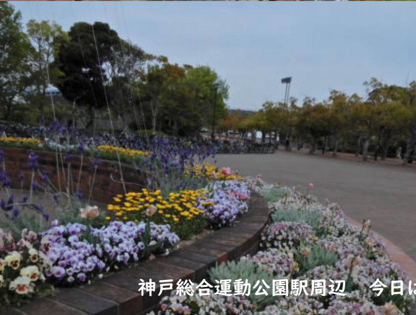
神戸総合運動公園駅周辺 今日は平日 イベントがないので静かなもの 2022.4.9.