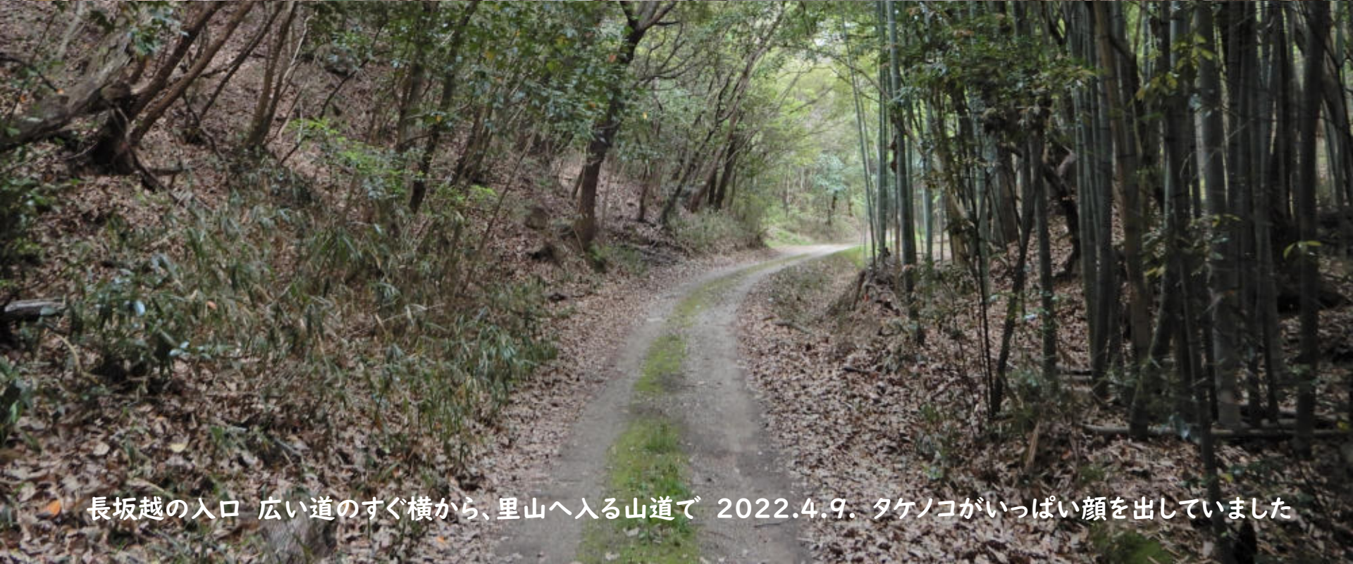
● 長坂越の入口 広い道のすぐ横から、里山へ入る山道で 2022.4.9. タケノコがいっぱい顔を出していました