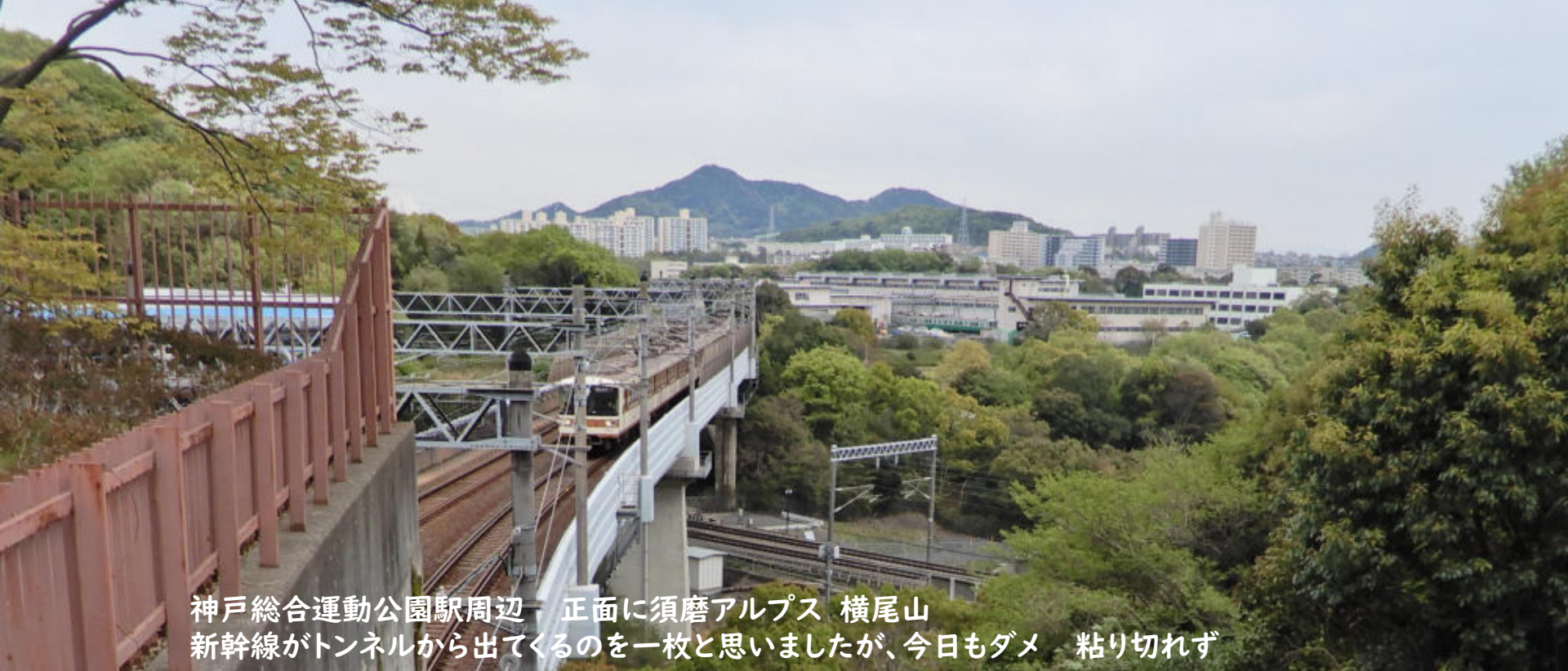
神戸総合運動公園駅周辺 正面に須磨アルプス 横尾山 新幹線がトンネルから出てくるのを一枚と思いましたが、今日もダメ 粘り切れず