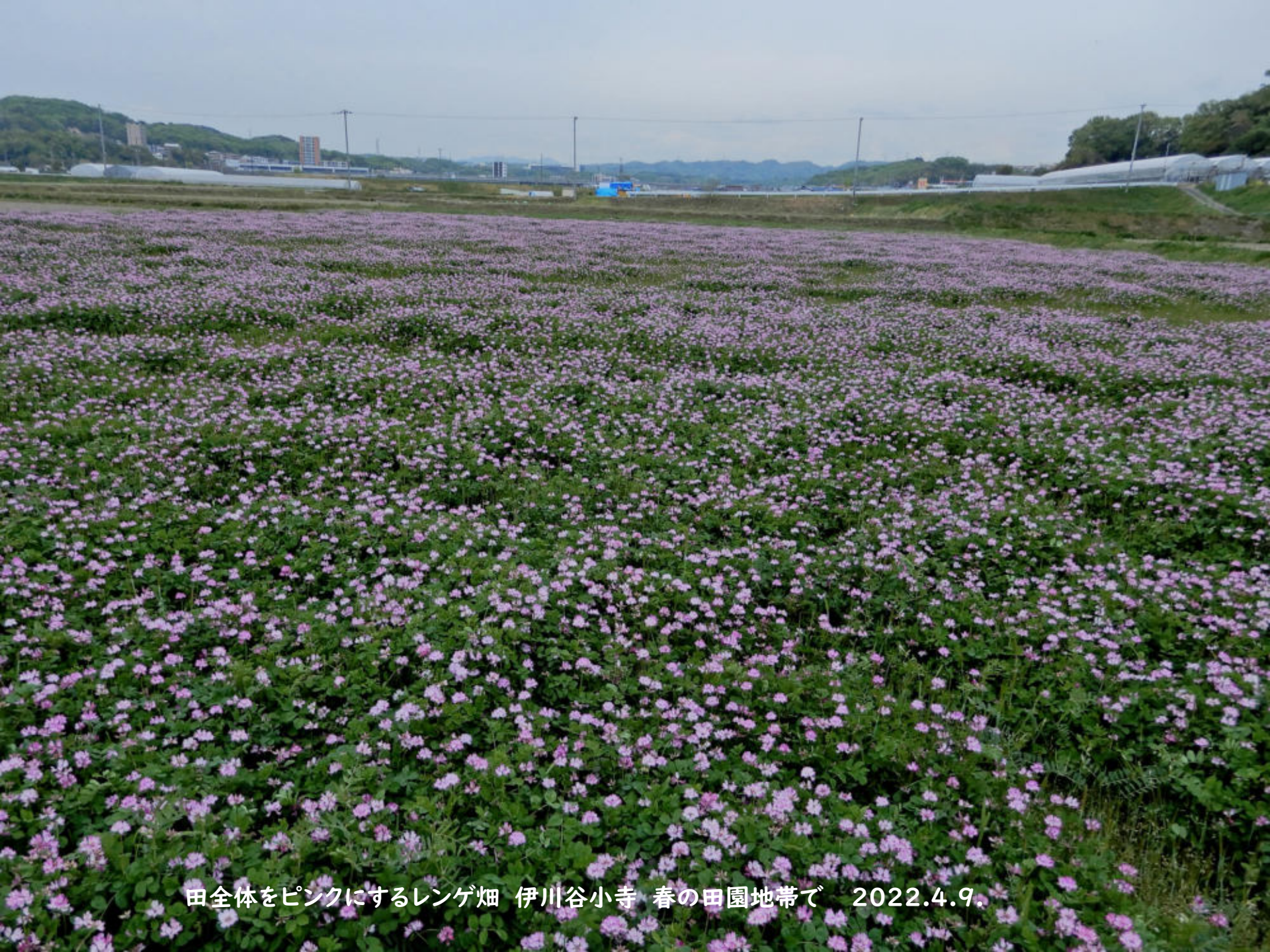
田全体をピンクにするレンゲ畑 伊川谷小寺 春の田園地帯で 2022.4.9.