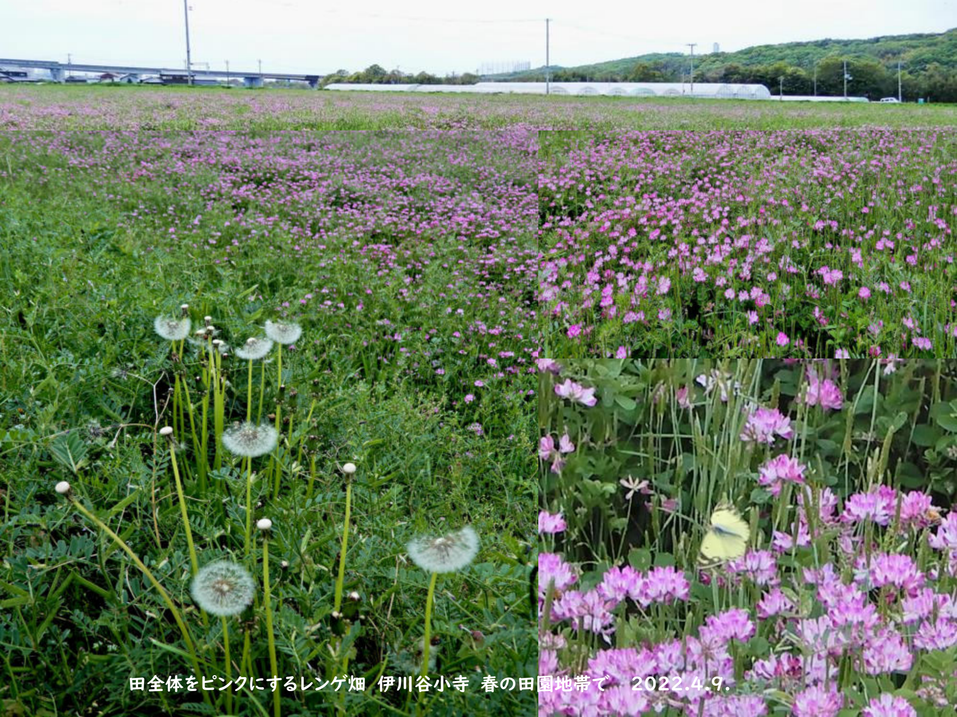
田全体をピンクにするレンゲ畑 伊川谷小寺 春の田園地帯で 2022.4.9.