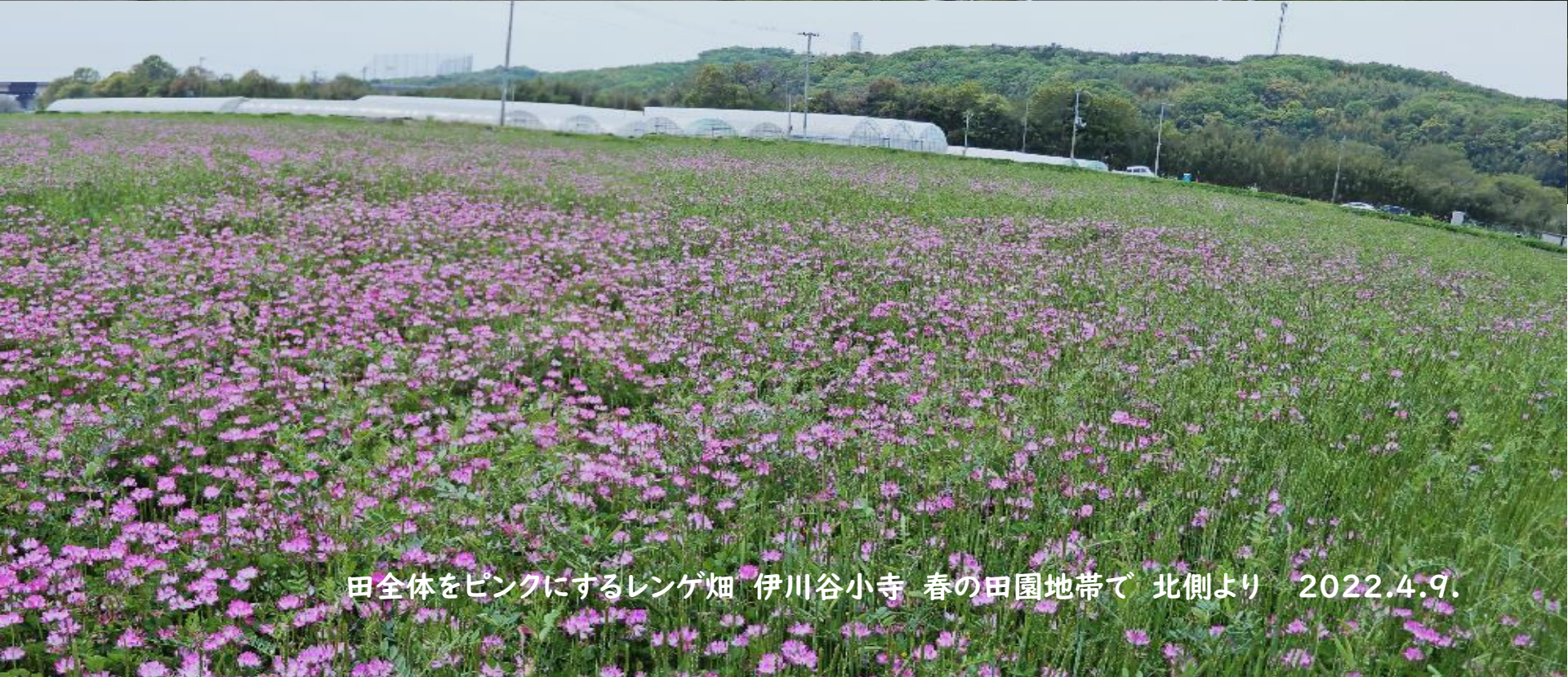
田全体をピンクにするレンゲ畑 伊川谷小寺 春の田園地帯で 北側より 2022.4.9.