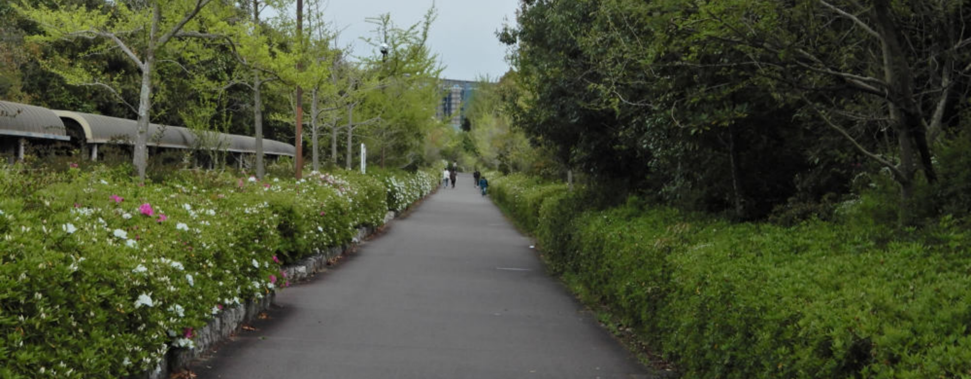
学園都市駅周辺 山麓バイパス沿い東へ総合運動公園への遊歩道 2022.4.9. もうサツキが咲き始め 南側のサツキは神戸外大の高い緑の生垣で陽が差さないのか、遅れている