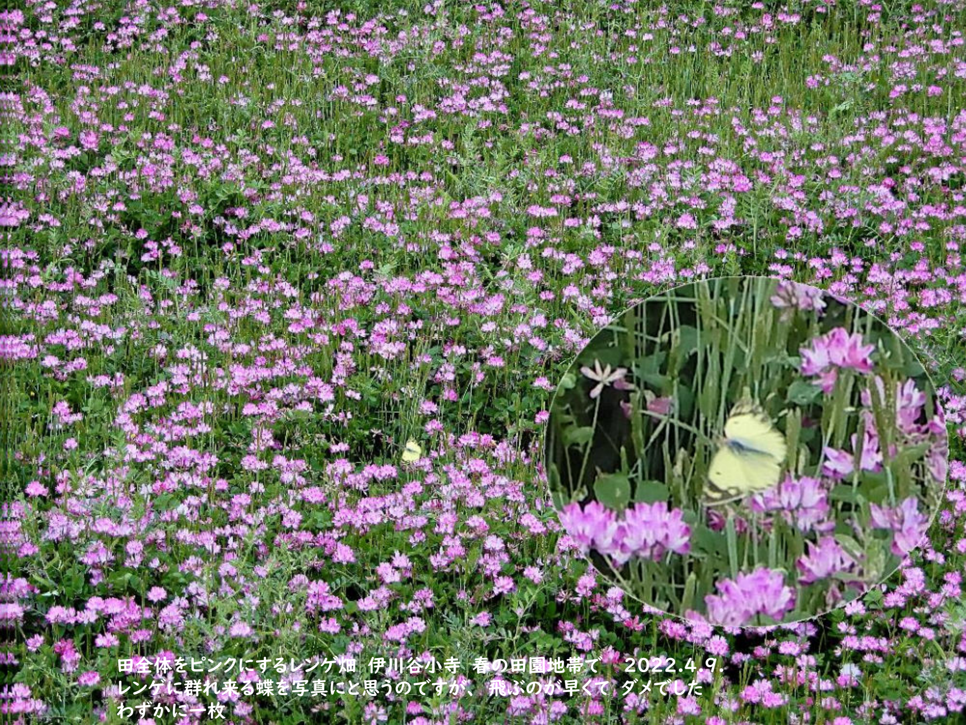
田全体をピンクにするレンゲ畑 伊川谷小寺 春の田園地帯で 2022.4.9. レンゲに群れ来る蝶を写真に思うのですが、飛ぶのが早くてダメでした わずかに一枚