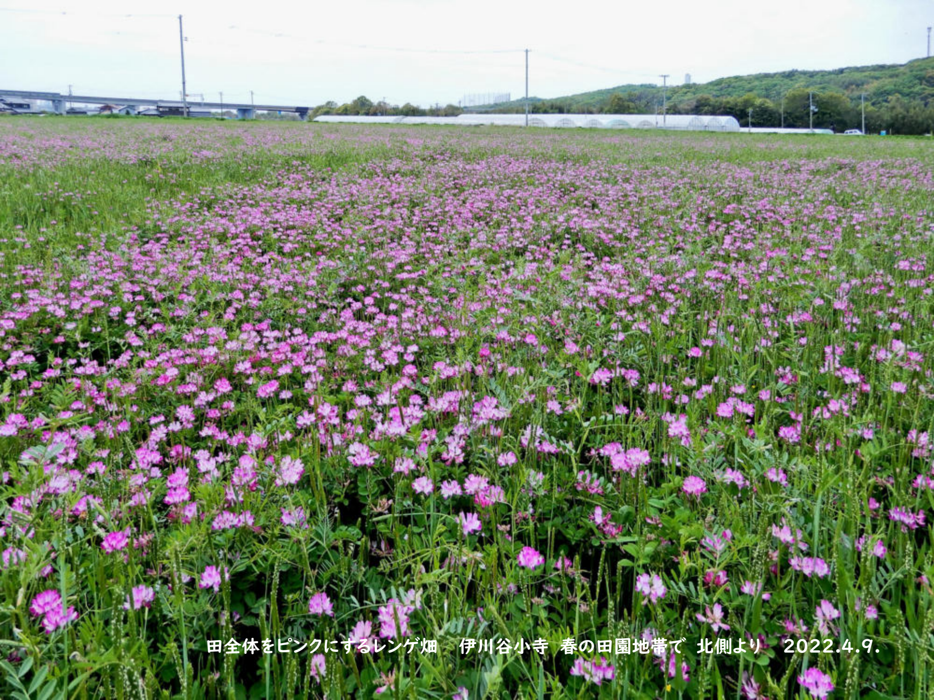
田全体をピンクにするレンゲ畑 伊川谷小寺 春の田園地帯で 北側より 2022.4.9.