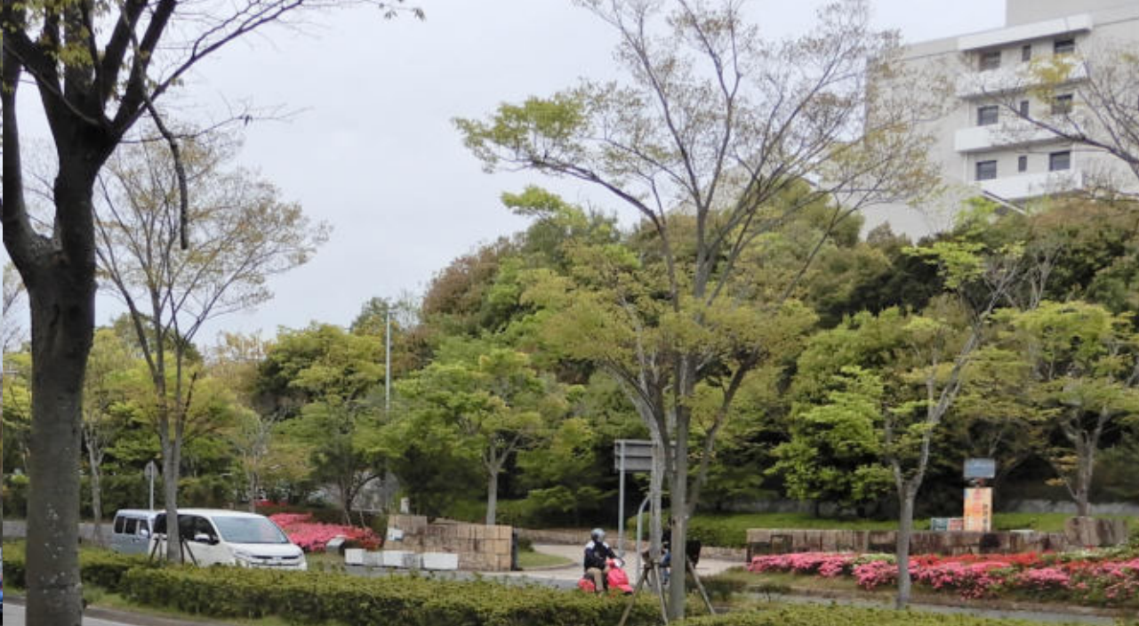
学園都市駅周辺 2022.4.9. バス道路を北へ 学園都市駅前へ 目的は久しぶりにマクドで お茶してから帰る