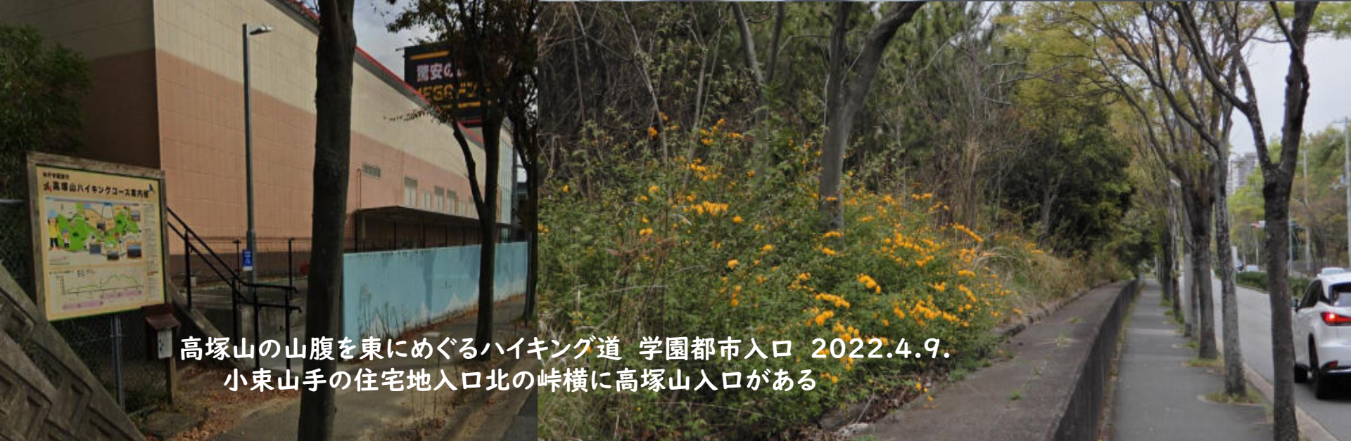
高塚山の山腹を東にめぐるハイキング道 学園都市入口 2022.4.9. 小束山手の住宅地入口北の峠横に高塚山入口がある